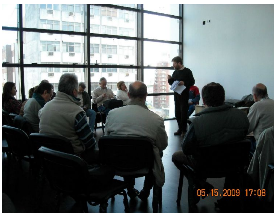
Figura 5: Capacitación de capacitadores. Docentes de escuelas Agrarias de la Provincia de Buenos Aires, 2009.

Por otro lado, se ha tratado de abordar al grupo de trabajadores como tal, favoreciendo el intercambio y la relación constructiva de manera de promover la relación maestro – aprendiz. Por ejemplo, se ha tratado de desdibujar la idea de la evaluación individual. Esto ha permitido enfocar a la jerarquización del oficio del trabajador de los alimentos como un agente de salud y como servicio público.