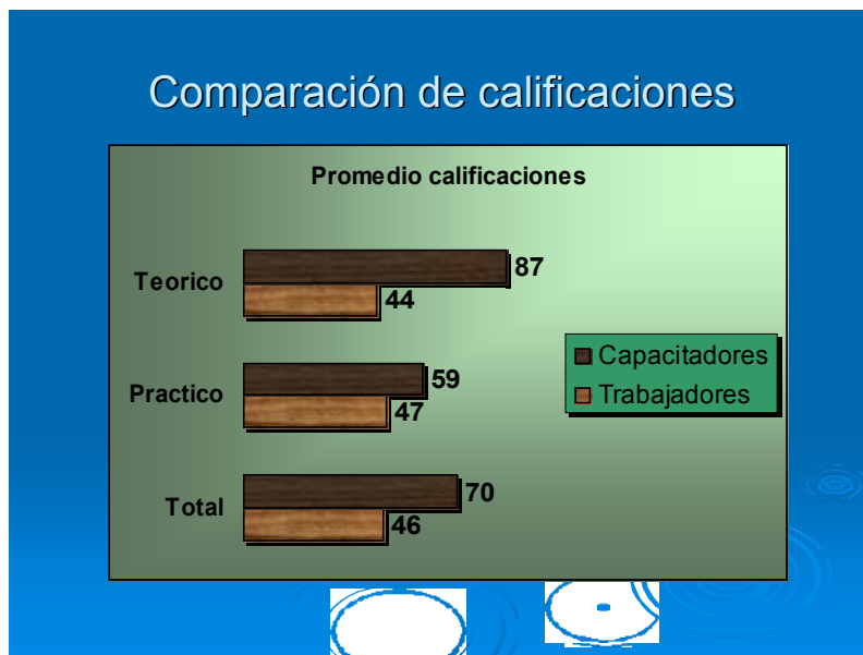
Figura 3: calificaciones comparativas de trabajadores y capacitadores, discriminadas por teoría y práctica.

Esto indica que existe una manera diferente de abordar los conocimientos por parte de un trabajador de oficio y un capacitador profesional. Y sin calificar como superior a una o a otra forma, es evidente que esta situación encierra una dificultad real durante la capacitación de trabajadores, por parte de profesionales capacitadores, basada en la diferencia en las percepciones respecto de la teoría necesaria para abordar la tarea práctica (el trabajo de producción).