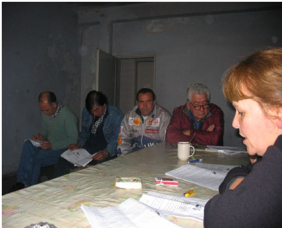
Figura 4: Taller de capacitación de la Cooperativa El Tolosano, Fábrica Recuperada (2007).

ofrecer un modelo de abordaje de la problemática planteada que pudiera ser absorbida por parte del Estado. Tanto desde el punto de vista formal como desde la generación de herramientas validadas para la capacitación de colectivos de trabajadores. Ciertamente, la prevención de las enfermedades transmitidas por alimentos basada en la implementación de buenas prácticas de manipulación es una tarea relacionada a la salud. De hecho, las estructuras estatales, a nivel nacional provincial o municipal, dedicadas a estas cuestiones, dependen del área salud y no del área producción o trabajo. Sin embargo, en la práctica se implementan desde el punto de vista de la producción de alimento como mercancía.